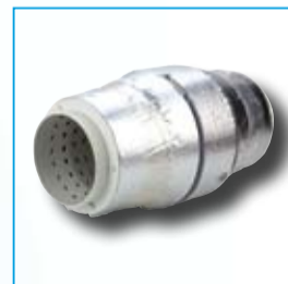
Recubrimiento con material fonoabsorbente para evitar la salida del ruido al exterior