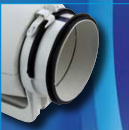
Bridas en bi-material para facilitar la instalación y garantizar la estanqueidad

La gama TD-SILENT es el resultado de miles de horas de diseño e investigación en los laboratorios de S&P para conseguir un producto de altas prestaciones reduciendo el nivel sonoro en más de 12 dB(A). Esto se ha traducido en la gama de ventiladores más silenciosos del mundo en su categoría.