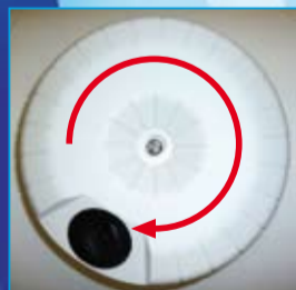
Caja de bornes con tapa giratoria 360° para facilitar la entrada del cable desde cualquier ángulo