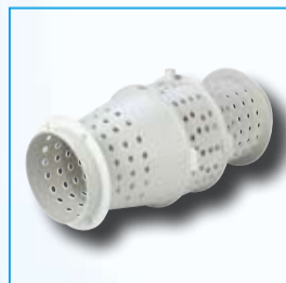
Cubierta perforada para direccionar las ondas sonoras emitidas por el motor