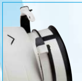
Cierres en bi material para facilitar el desmontaje del cuerpo motor