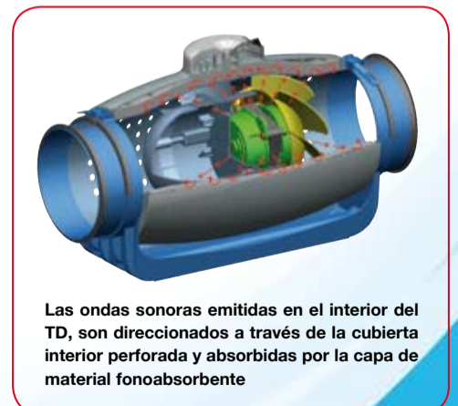
Las ondas sonoras emitidas en el interior del TD, son direccionadas a través de la cubierta interior perforada y absorbidas por la capa de material fonoabsorbente